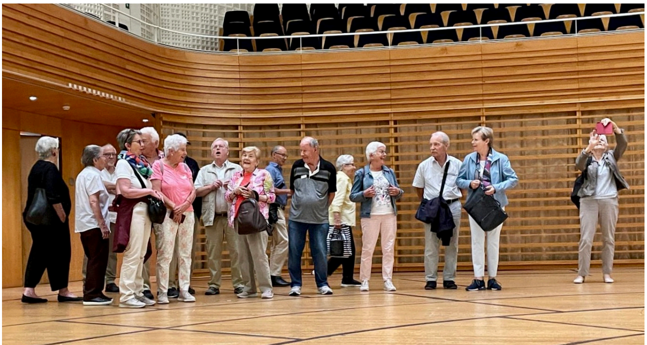
Der Chor der Seniorenturner Wallisellen auf der Bühne eines der zehntbesten Konzertsäle der Welt