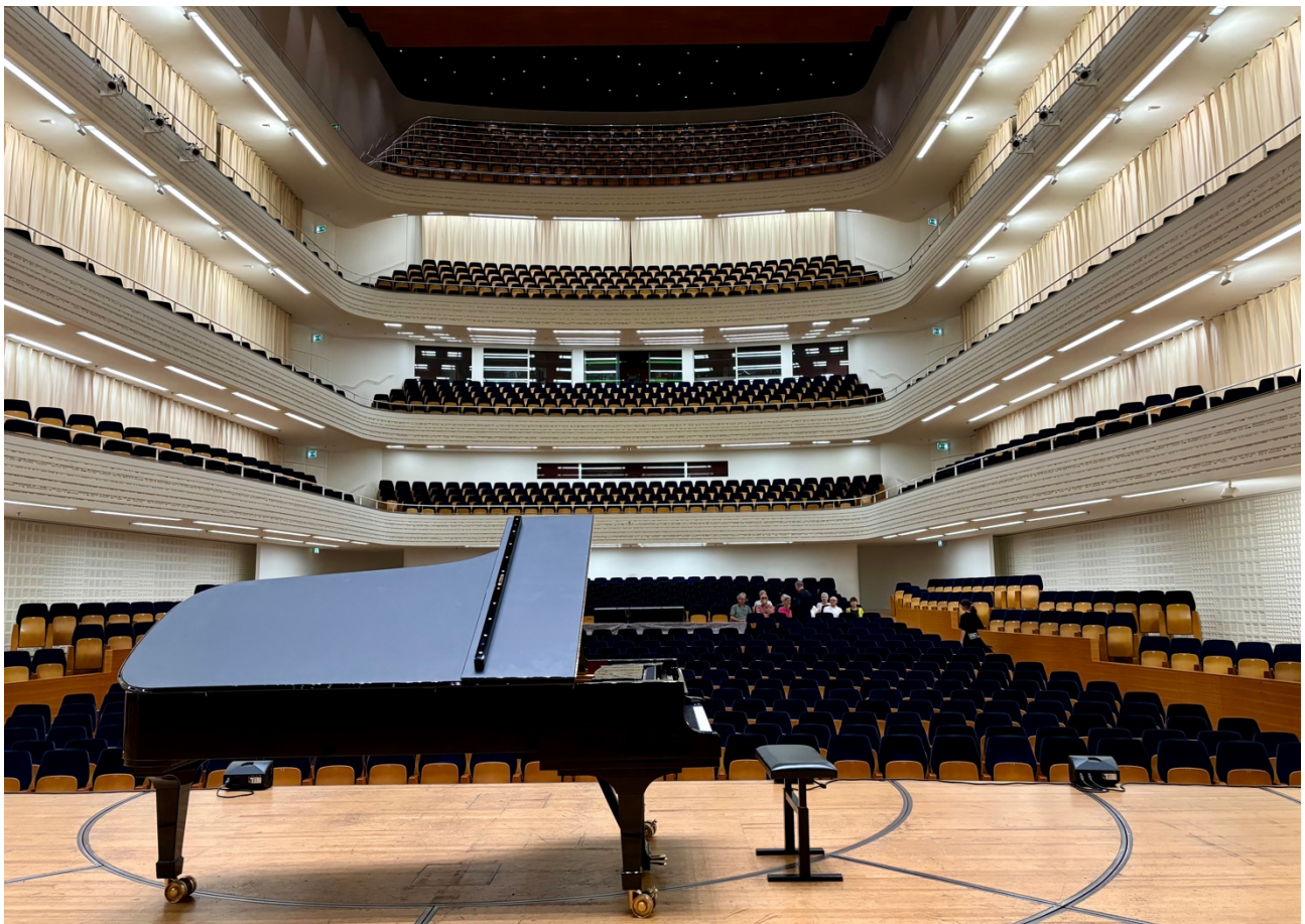
Ein ungewohntes Bild: der nahezu leere Konzertsaal des Kultur- und Kongresszentrum Luzern

Schon von weitem ist der prächtige Bau des Kultur- und Kongresszentrum Luzern (KKL) zu sehen. Nach den Plänen des Architekten Jean Nouvel erbaut, wurde dieser multifunktionale Bau 1998 eröffnet. Ursprünglich sollte das ganze Gebäude direkt in den Vierwaldstättersee gebaut werden, was aber aus ökologischen Gründen nicht möglich war. Doch Nouvel wollte sein Gebäude mit dem Wasser verbunden haben. So führt er mit seinem Projekt „Inclusion“ in Kanälen Wasser aus dem See direkt ins Gebäude hinein. Und mit dem ausladenden Dach bis über den See hinaus unterstreicht der Architekt die Verbundenheit seines Baus mit dem Wasser. Unter dem riesigen Dach sind drei Gebäude vereint: der Konzertsaal, der Kongresstrakt und das Kunstmuseum Luzern. Finanziert wurden die Baukosten von 227 Mio. Franken durch die öffentliche Hand, private Investoren und viele Mäzene.